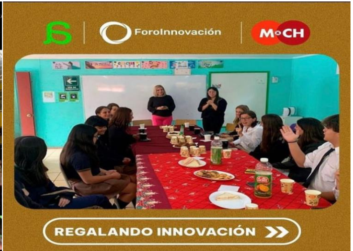
REGALANDO INNOVACIÓN >>>