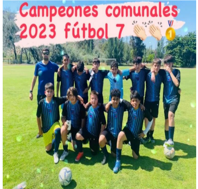
PARTICIPACION EN CAMPEONATO