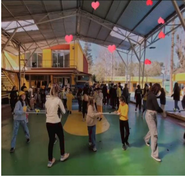
DIA DEL INGLES