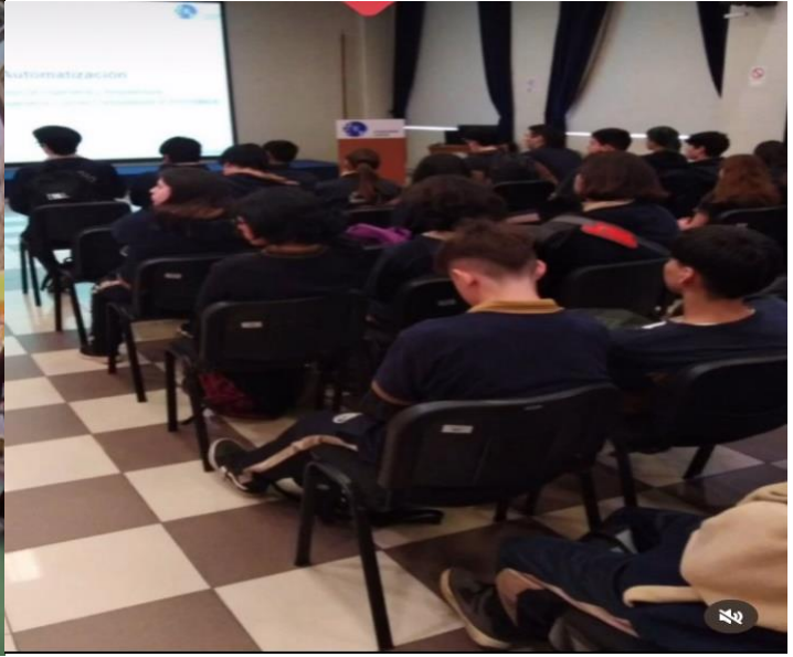
PREMIO FORO INNOVACION